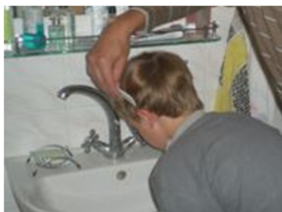
Vyčesávání vší z hlavy dítěte nad umyvadlem.

Zavšivení dítěte lze prokázat nebo vyloučit pouze vyčesáváním vší pomocí speciálního hřebínku tzv. „všiváčku“ (běžně k dostání v drogeriích a zdravotnických potřebách). Vyčesávání vší je vhodné provádět nad světlou podložkou, popř. nad umyvadlem či vanou, na které jsou vyčesané vši dobře viditelné. Pravidelné vyčesávání vlasů všiváčky je hlavní a účinná prevence před šířením vší. Opakovaným vyčesáváním vší všiváčkem lze již během několika vyčesávání docílit úplného vymizení vší i bez aplikace od všivovacích přípravků. Vyčesávání vší je nutné provádět od kořínek vlasů minimálně 5 minut postupně z celého povrchu vlasaté části hlavy alespoň každý třetí den. Vší se musí vyčesávat, dokud se vyskytují, minimálně však ještě dva týdny po nález poslední dospělé vší. U některých typů delších vlasů je však vyčesání všech vší technicky neproveditelné. Rovněž ostříhání vlasů na méně než 0,8 cm je osvědčená metoda jak zamezit výskytu vší. Obecně platí, že po každém řádném použití jakéhokoliv přípravku proti vším nebo po důkladném vyčesání vší „všiváčkem“, je možno považovat dítě za neinfekční a zařadit ho do dětského kolektivu.